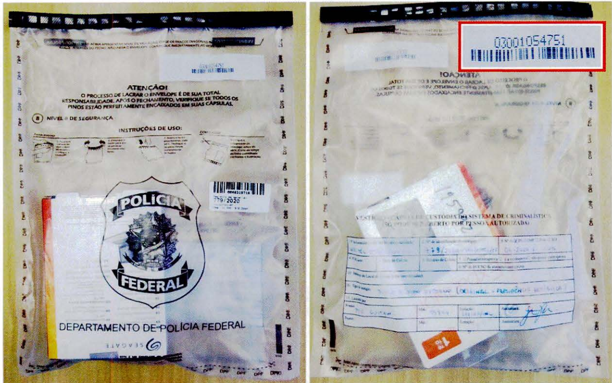
Figura 1: Material questionado acondicionado em envelope de segurança padrão PF nº 03001054751. Frente (esquerda) e verso(direita).

Criminalística como Material Nº 779/2020 – INC/DITEC/PF , da marca SEAGATE , modelo EXPANSION , número de série NA88DDP3 , patrimônio da Presidência da Republica nº 195.1992 . O material é apresentado nas Figuras 1 e 2.